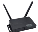
IoTルータ 広く産業用途の機器と接続可能なLTEルータ